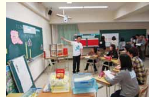
標茶町立磯分内小学校との共同研究を踏まえたフォーラム 複式模範授業とパネルディスカッション