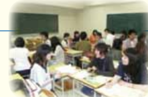
事前指導/実習生交流会 前年度実習生から直接アドバイス

実習の事前・事後には、経験ゆたかな「へき地教育アドバイザー(共同研究員)」が学生の指導にあたっています。