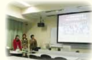
事後指導/実習校ごとの報告会