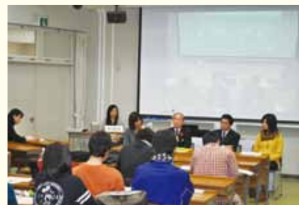
学生ボランティアフォーラムの様子

北海道内の市町村等が実施する児童生徒の生活習慣の定着などを図るための放課後や休日、通学合宿等を活用した取組を支援する学生ボランティア派遣事業を北海道教育委員会と連携して実施しています。この事業には、全キャンパスから多くの学生が参加しています。また、実施後のまとめとして「学生ボランティアフォーラム」を開催し、学生ボランティアの活動報告を通して、北海道の教育について考える機会を設けています。